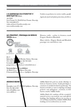
Logotip v katalogu (naklada 1.000 kom.)