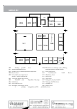
Barvni logotip v sejmskem programu prireditvev ob skici prostora